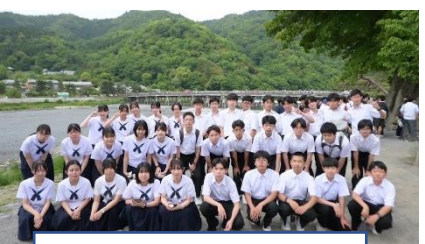
5組 嵐山渡月橋にて