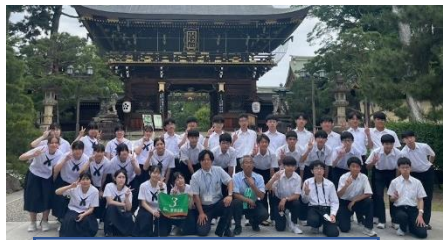
3組 北野天満宮にて