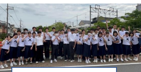
6組 伏見稲荷の近く？